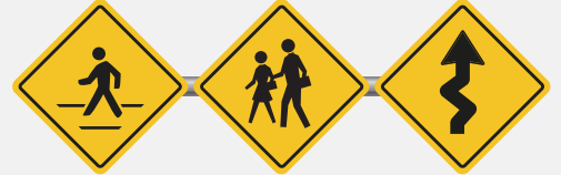
ระวังคนข้ามถนน เขตโรงเรียนระวังเด็ก ทางแคบเคี้ยว